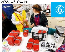
先輩ボランティアから説明を受ける受講者