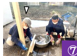
隊員と一緒に換気扇の洗浄をする受講者