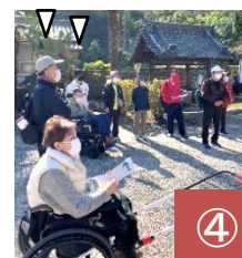
まち歩き途中、いっぽの会会員と共に観光ガイドボラの話聞く受講者