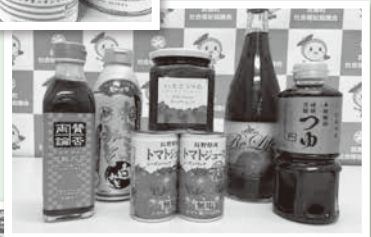
調味料・ジュース