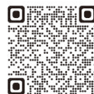
『デイサービス榊原』さんのホームページはコチラ