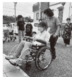
(車いすの操作について学ぶ受講者)

申込み 問合せ 武豊町社会福祉協議会 地域福祉係 TEL: 0569-73-3104 E-mail info@taketoyo-shakyo.com