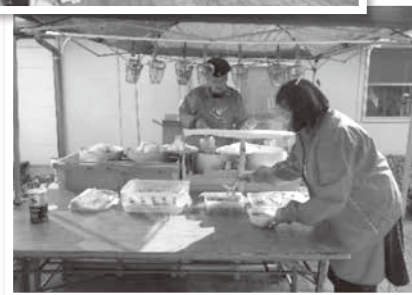
ラーメンを配膳している 武豊ライオンズクラブさん