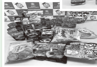
菓子・インスタント麺