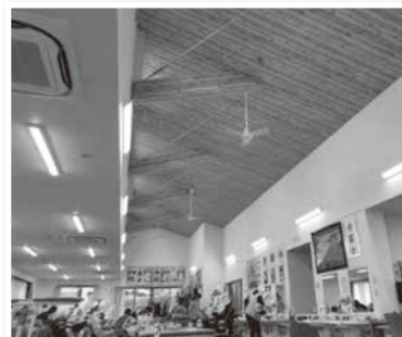
(デイサービス榊原さんの施設内)