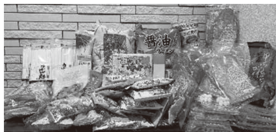
ファミリーマート武豊桜ヶ丘店で受け付けた寄付の一部