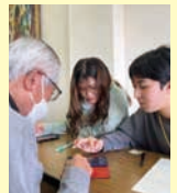
大学生2名により学ぶ受講者