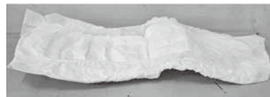
(このパッドが水を吸うと…)

ちなみに、下着と一緒に洗濯してしまった場合は不織布が破れて洗濯槽や洗濯物にポリマーが付着してしまうため、こちらも十分気をつけてくださいね。