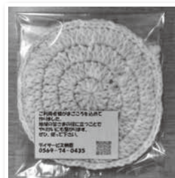
(利用者さんの手作り小物アクリルたわし)