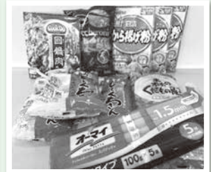
パスタ・凍り豆腐 調味料